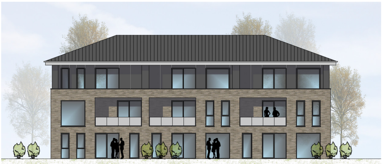
HAUS 3 ANSICHT VON WESTEN | M100