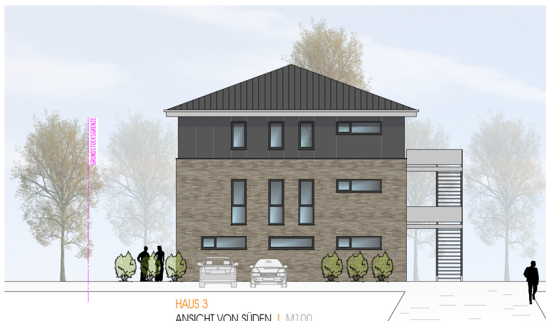
HAUS 3 ANSICHT VON SÜDEN | M100