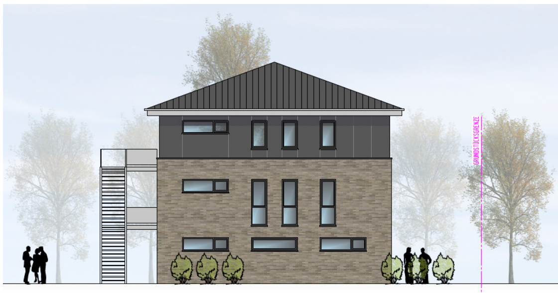
HAUS 3 ANSICHT VON NORDEN | M100